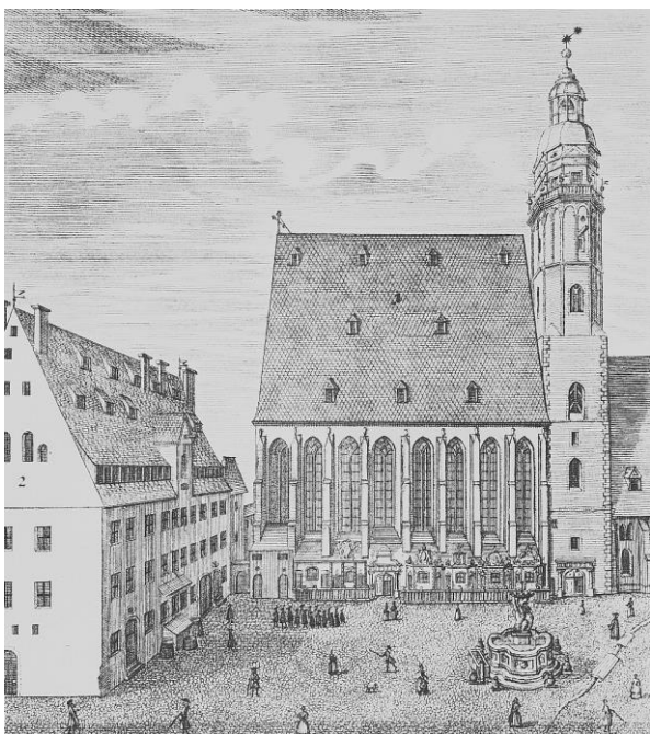
Școala și Biserica Sfântul Toma din Leipzig

amănuntele cele mai lipsite de însemnătate să rămână întipărite în mintea acelor care iubesc, așa că s-ar putea ca ultimul meu gând conștient să nu fie ziua nunții sau a nașterii primului nostru copil, ci clipa când a cântat fuga, cuprinzându-mă cu unul dintre brațele sale, sau când m-a sărutat pe pragul casei noastre din Leipzig.